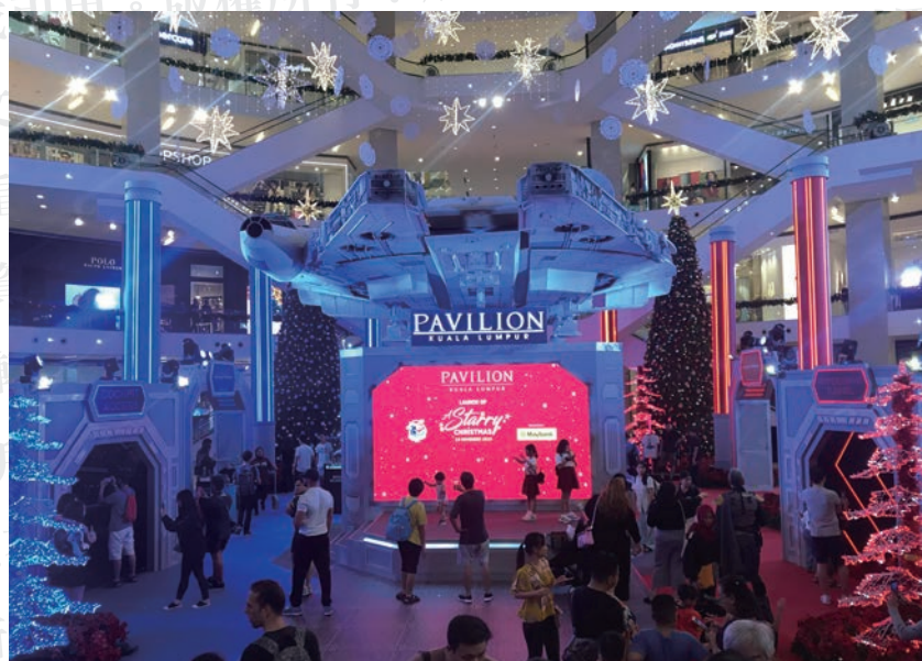
唯一的觀光行程-巴比倫（Pavilion）購物廣場

場（Pavilion KL），吉隆坡的武吉免登區（Bukit Bintang）集結了數家有名的購物商場，除了巴比倫廣場，其他較大的還有Mid Valley, Sunway pyramid及雙子星塔內的陽光廣場（Suria KICC），CNN旅遊專欄還曾指出吉隆坡可能取代紐約、倫敦、東京、巴黎其中之一成為世界上第四大購物天堂。不過市區交通尖峰時刻塞車問題也很嚴重，我們搭Uber前往Pavilion，去程花了將近一個半小時，沒想到回程居然只花了10分鐘。Pavilion週邊人潮車潮眾多，各大精品品牌林立，好不容易擠進去後吃了晚餐買了一些肉骨茶包（當時因為非洲豬瘟疫情，還特別確定過單純的肉骨茶包其實是中藥，是可以過海關的）準備帶回台灣後就結束行程了。