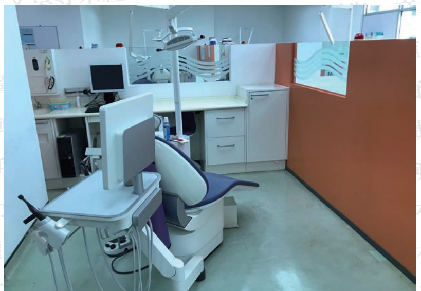
student clinic診間隔間板上的紅燈就是學生要check時可以按的