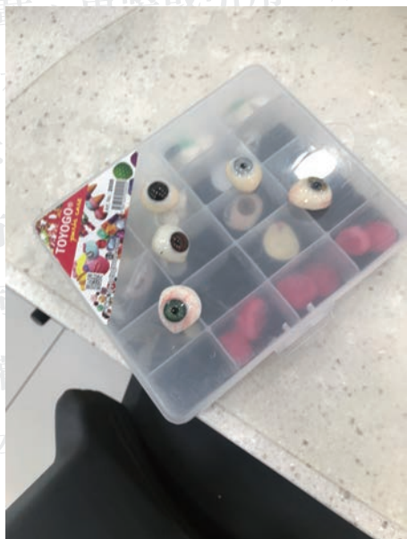
除了denture之外，也有製作顏面補綴物