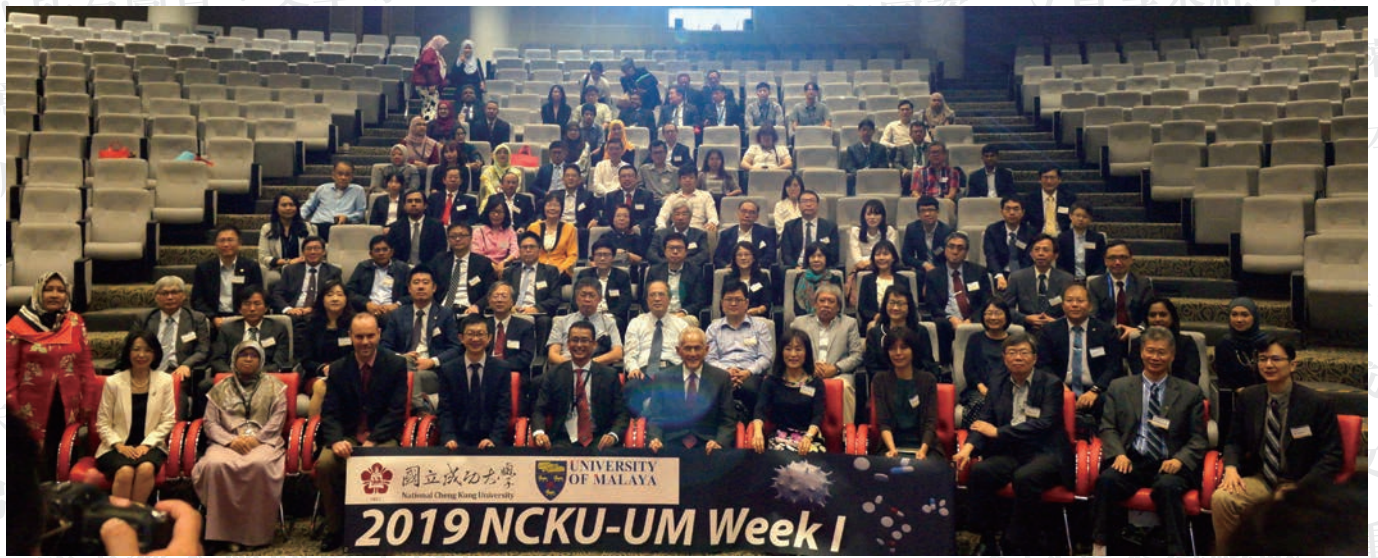
2019 NCKU-UM Week

分，如實習醫師進行crown及class II cavity preparation後，掃描模型後提示學生preparation的缺點後再進行一次後測，評估是否會有進步。以及臨床部分由成大口外提出的最優化對稱面分析（optimal symmetric plane system）應用於facial asymmetry患者的正顎手術。同時也與其他參加者進行交流討論，也可感受到馬大對於培養學生及實習、住院醫師進行研究的重視。