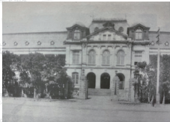
台北帝國醫學部時代的校本館留下來的建築，就是二號館。細看其正面的三扇窗有羅馬式的拱門外框，並以圓柱分隔，框頂之山牆中央有巴洛克式的飾雕 (adornment)，充滿裝飾之美。