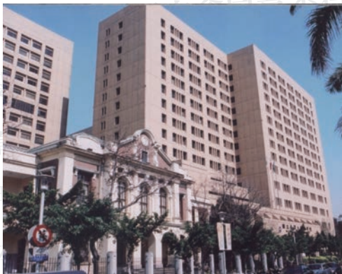
2008 年左右的台大基礎醫學大樓和二號館，左後方是台大醫院東址的一部分

這古蹟雖留下來，但無經費整修與維護，日漸損壞，經不起幾次颱風，屋頂都沒了。直到醫院新大樓使用後，李登輝前總統住進十五樓病房，從病室的窗外俯視，就看到破爛的二號館屋頂，他覺得很不好看，這才在大人物的支持下，獲得機會整建二號館。