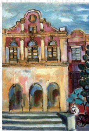
午後的二號館 oil on canvas, 55x45cm, 1999

2008年以前，我受當時的醫學院院長謝博士教授的委託，當起醫學院非正式的“藝術總監”，除了開“視覺藝術概論”兩學分的通識教育課以外，更積極幫忙整建破舊的二號館，以及整建後的內部使用規劃。整建快完成時，我負責籌辦一間歐式裝潢的Café，命名為“楓城交誼廳”，賣起咖啡與茶點，請了兩位退休的同仁服務，我設計menu，採購原料，選用糕點與杯具、器皿，還發行點券，成為院方犒賞績優人員及各單位邀請來講演的講者贈與感謝狀之外的贈品。除了師生來談研究，導師請導生喝下午茶等交誼活動之外，很多藥商、器材商常利用這場地，約醫師來介紹和推銷產品，而附近的幾處公家機構的員工，以及來看古蹟的遊客也常來享用。鼎盛時期，在中午及下午常座無虛席，擺設的十個桌子都不夠用。