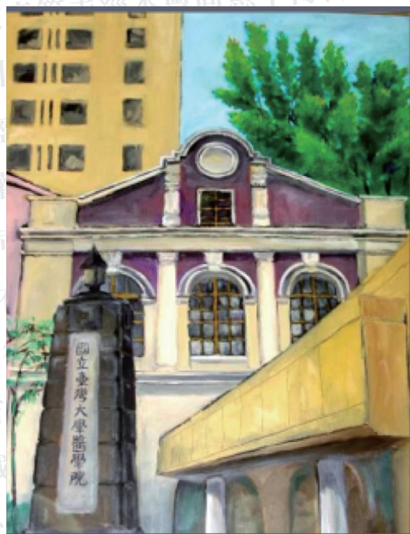
醫學殿堂 oil on board, 120x100cm, 2001。圖中右下方建築是醫學院大門。作畫之後約十年，才於大門上之陽台外牆釘上“國立台灣大學醫學院”的名銜貼字與院徽。

在這幅比較正經的大畫中，我將新的醫學院、醫院與整修過的二號館湊在一起，改變了他們之間的相對位置，也改變各建築的大小比例，以二號館為主角，新建築為配角。那個原先擺在二號館正前方大門口的石柱，經過拆解、移動又重組後，目前立在醫學院大門口，車輛引道出口的兩旁，我又把它拉到二號館前。這樣，我的畫，就不與任何照片相同，新舊並存，也穿越時空了！這幅畫，我命其名為“醫學殿堂”，現在掛在醫學院院長室前的牆上，也算是我對台大醫學院的小小貢獻。